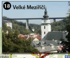
18 Velké Meziříčí