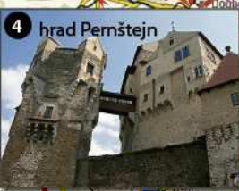
4 hrad Pernštejn