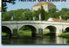
12 Náměšť nad Oslavou