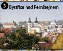
3 Bystrice nad Pernštejnem