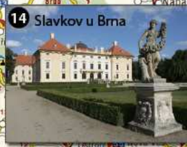
14 Slavkov u Brna