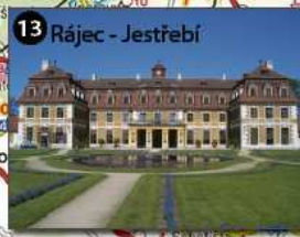
13 Ráječ - Jestřebí