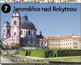
7 Jaroměřice nad Rokytňou