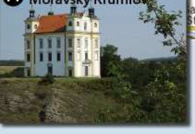
11 Moravský Krumlov