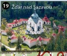
19 Žďár nad Sázavou